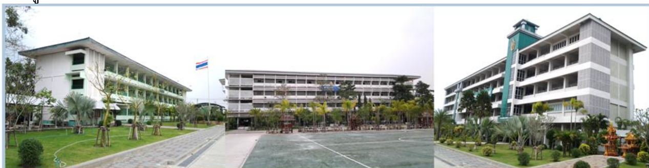
อาคารกำพล วัชรพล